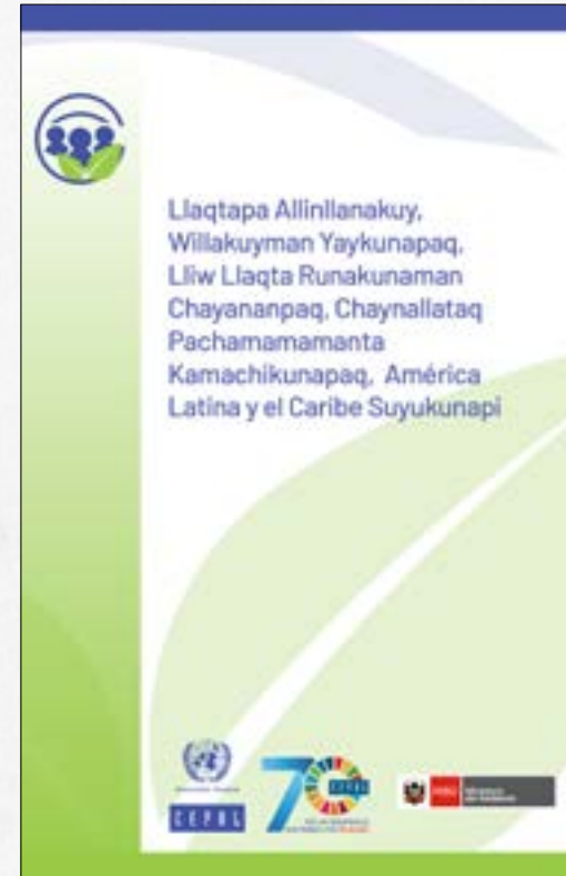
Acuerdo de Escazú (en quechua)