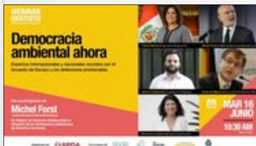
Importancia del Acuerdo de Escazú y su ratificación