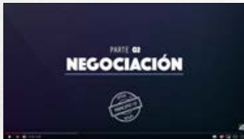
¿Cómo fueron las negociaciones para llegar al Acuerdo de Escazú?