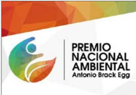
SPDA gana Premio Nacional Ambiental por serie de publicaciones sobre derechos de acceso