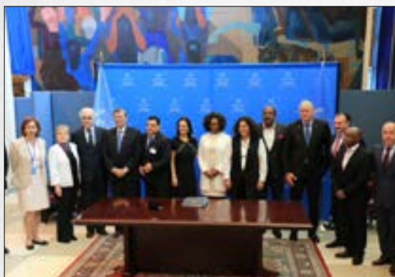
Escazú: un acuerdo regional que promueve la justicia ambiental en la mira