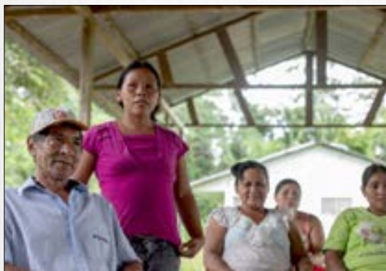
Expertos de ONU instan a ratificar Acuerdo de Escazú para promover empresas responsables