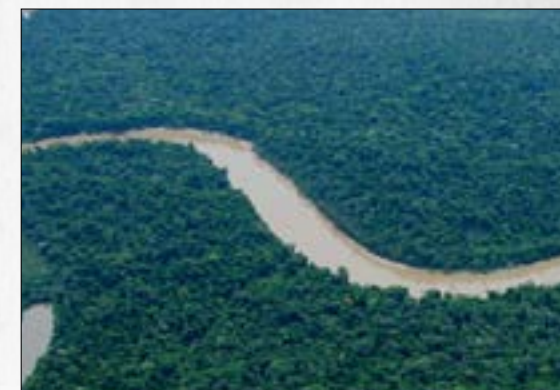
Acuerdo de Escazú: Dos posiciones ante rechazo de cinco gremios empresariales