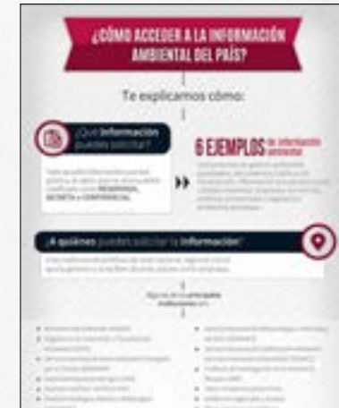
¿Cómo acceder a la información ambiental del país?