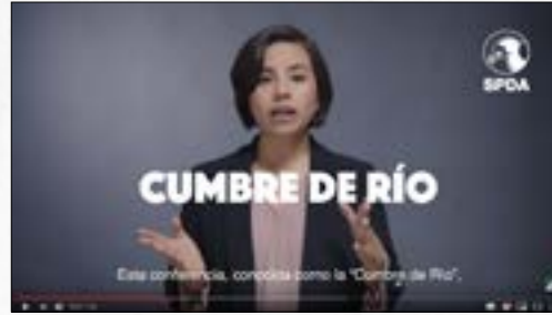
¿Cuál es el origen del Acuerdo de Escazú?