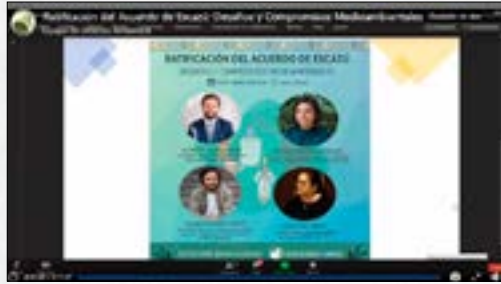
Ratificación del Acuerdo de Escazú: Desafíos y Compromisos Medioambientales