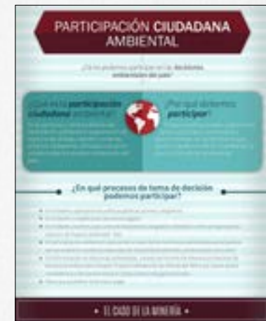
Participación ciudadana ambiental - Infografía