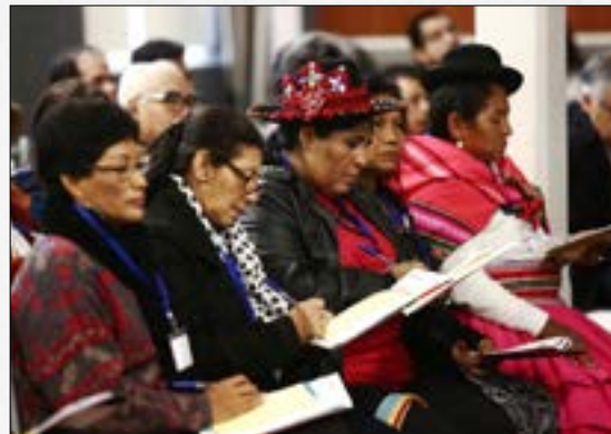
Diez mitos y verdades sobre el Acuerdo de Escazú: democracia y defensores ambientales