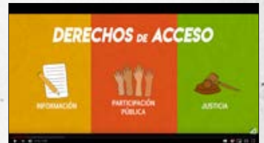
Acuerdo de Escazú: Derechos de acceso a la información, participación pública y justicia