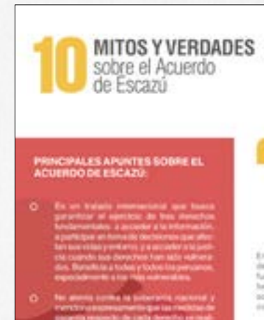
Diez mitos y verdades sobre el Acuerdo de Escazú