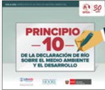
Principio 10: De la Declaración de río sobre el Medio Ambiente y el Desarrollo