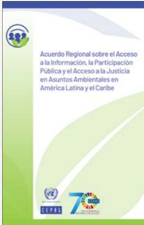
Acuerdo de Escazú (en español)