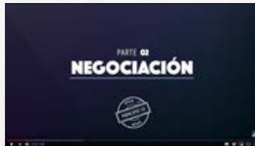
¿Por qué Perú debe ratificar el Acuerdo de Escazú?