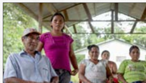
Foro regional "Acuerdo de Escazú"