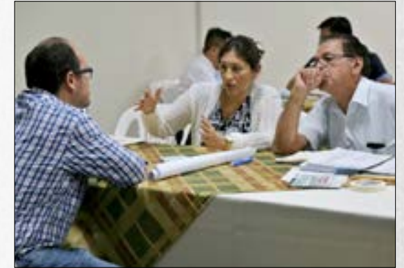
La Corte IDH resaltó la importancia de los derechos de acceso en América Latina