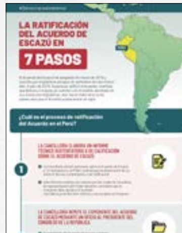
La ratificación del Acuerdo de Escazú en 7 pasos