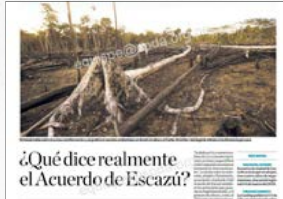
¿Qué dice realmente el Acuerdo de Escazú?