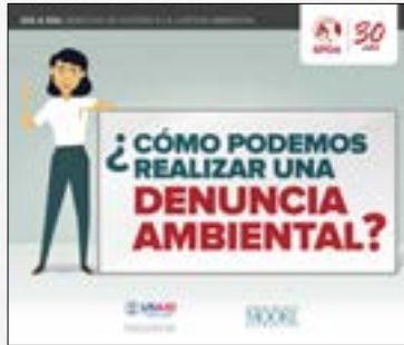
¿Cómo podemos realizar una denuncia ambiental?