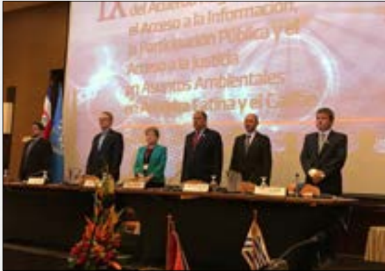
¡Confirmado! Perú sí suscribirá el Acuerdo de Escazú sobre acceso a información, participación y justicia ambiental