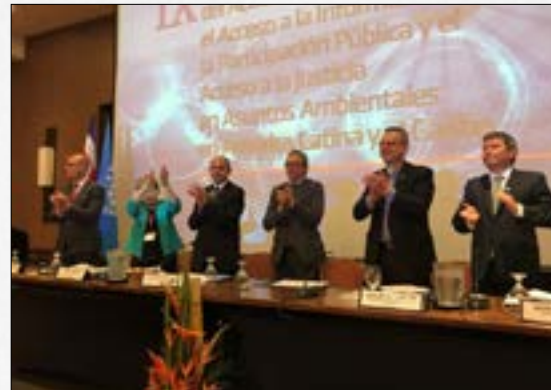
SPDA lidera equipo para difundir derechos de acceso en América Latina y el Caribe