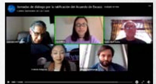
Jornadas de diálogo por la ratificación del Acuerdo de Escazú