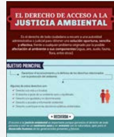
El derecho de acceso a la justicia ambiental - Infografía