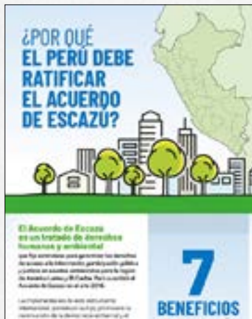
¿Por qué el Perú debe ratificar el Acuerdo de Escazú?