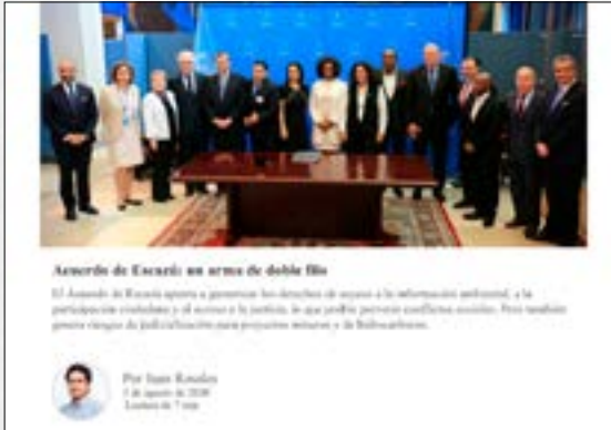
Acuerdo de Escazú: arma de doble filo