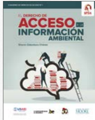
El derecho de acceso a la información ambiental