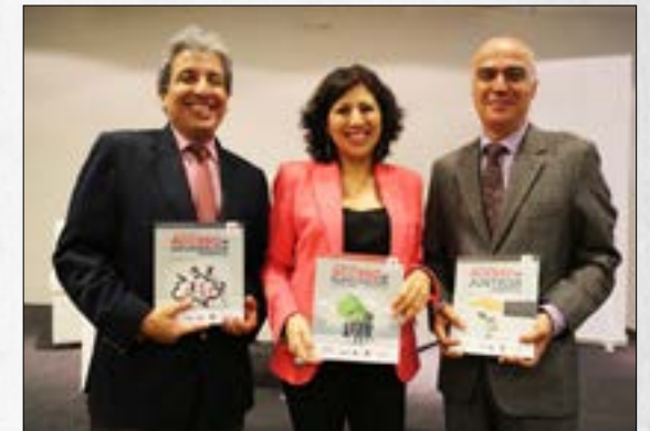
El Perú y los derechos de acceso a la información, participación ciudadana y justicia ambiental