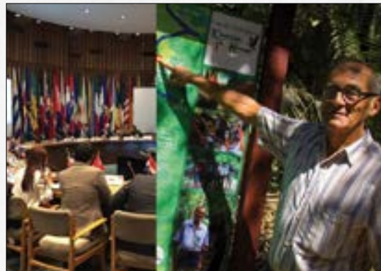
¿Quién defiende a los defensores ambientales?