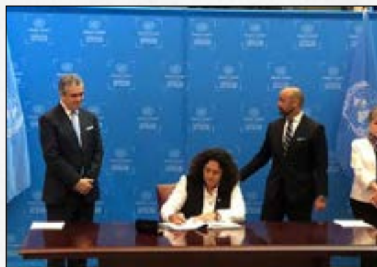
Acuerdo de Escazú: ¿Por qué cinco gremios empresariales se oponen al tratado?