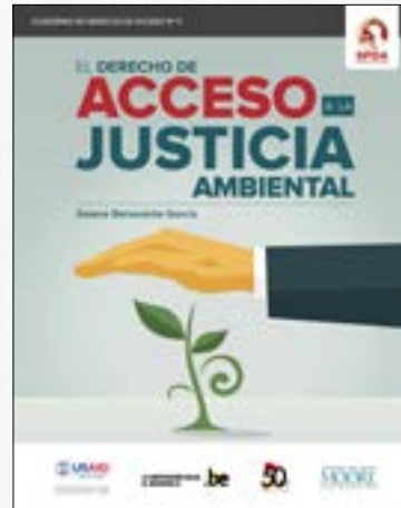
El derecho de acceso a la justicia ambiental