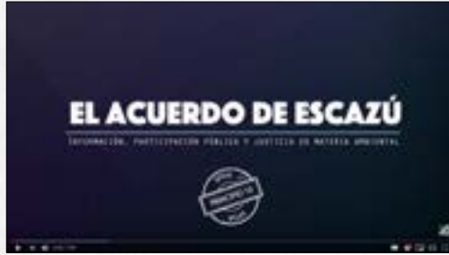
¿Qué es el Acuerdo de Escazú? ¿Por qué es importante que el Perú lo firme?