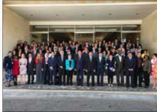
Histórico: se aprueba el "Acuerdo de Escazú" para la defensa de los derechos ambientales en Lationamérica