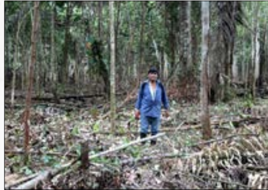
¿Cuál es el avance del proceso de ratificación del Acuerdo de Escazú en América Latina y El Caribe?