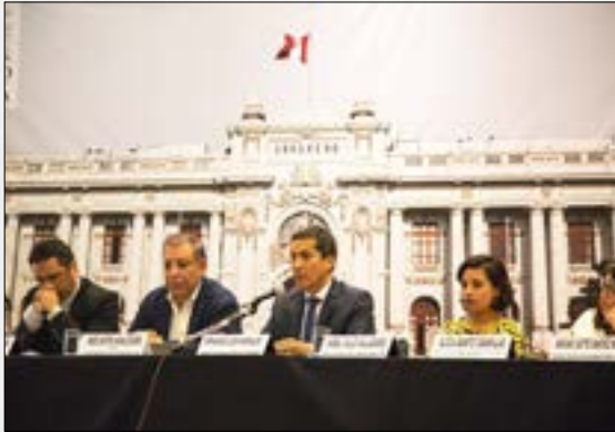
Perú apuesta por ser el primer país de la región en ratificar el "Acuerdo de Escazú"