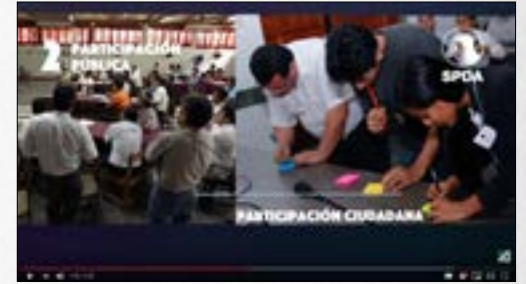
¿Cuáles son los principales puntos del Acuerdo de Escazú?