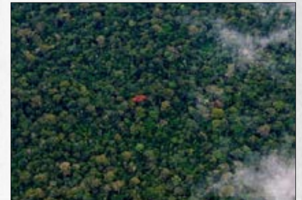
Verdades y mentiras sobre el Acuerdo de Escazú y su impacto para nuestro país