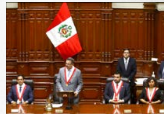
Representantes de la región aclaran dudas al Congreso sobre el Acuerdo de Escazú