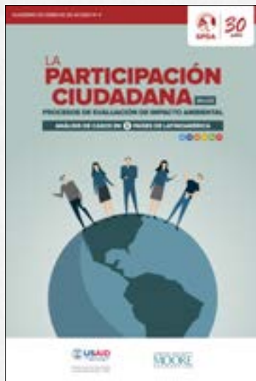
Derecho a la participación ciudadana ambiental en 6 países de América Latina