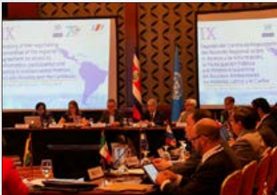
América Latina cerca de lograr Acuerdo sobre información y justicia ambiental