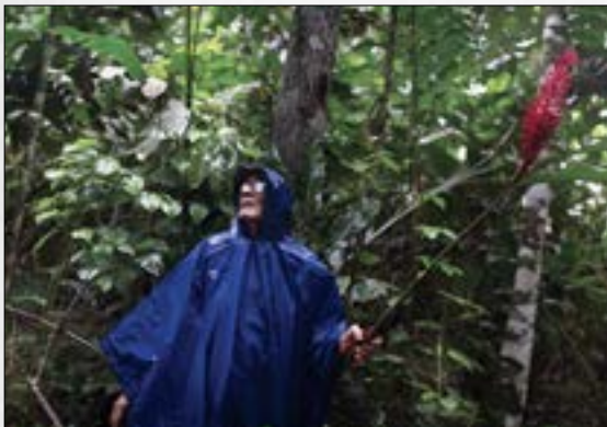
Acuerdo de Escazú y los defensores ambientales: ¿qué retos están pendientes?