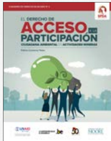
El derecho de acceso a la participación ciudadana ambiental en actividades mineras